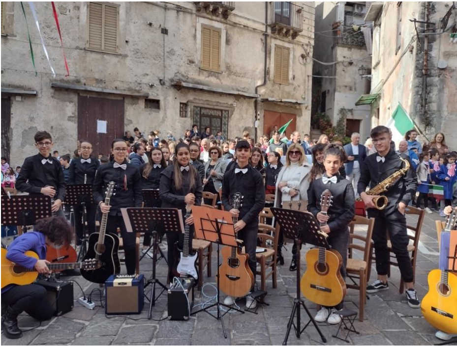
Orchestra e Musica